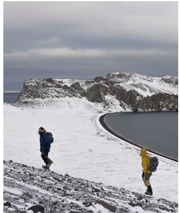
D'autres images de l'expédition ici

L'expédition avait été organisée en collaboration avec l'Union de la Nature, une organisation internationale créée par l'entreprise Earth Today. Elle regroupe des ONG latino-américaines, africaines, asiatiques et australiennes proposant un nouveau modèle pour parvenir à protéger 50 % de la Terre d'ici 2050. Lors de leur navigation en Antarctique, l'expédition a relevé des températures anormalement élevées par rapport aux normales de saison. Ils ont également pu naviguer bien plus au sud que ce que les glaces devraient permettre en cette saison, un mois après qu'un morceau de banquise de la taille de Rome se soit détaché du continent.