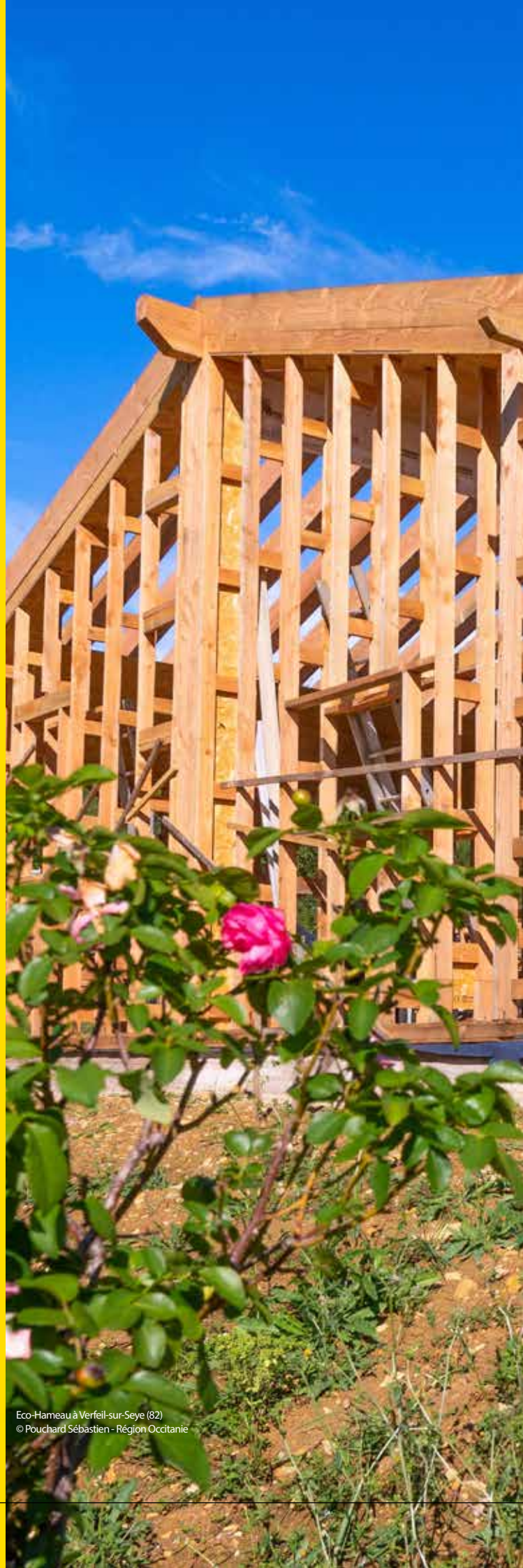
Eco-Hameau à Verfeil-sur-Seye (82)